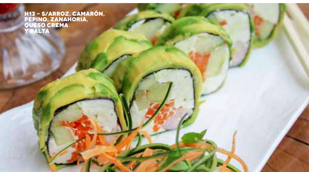
H13 – S/ARROZ, CAMARÓN, PEPINO, ZANAHORIA, QUESO CREMA Y PALTA