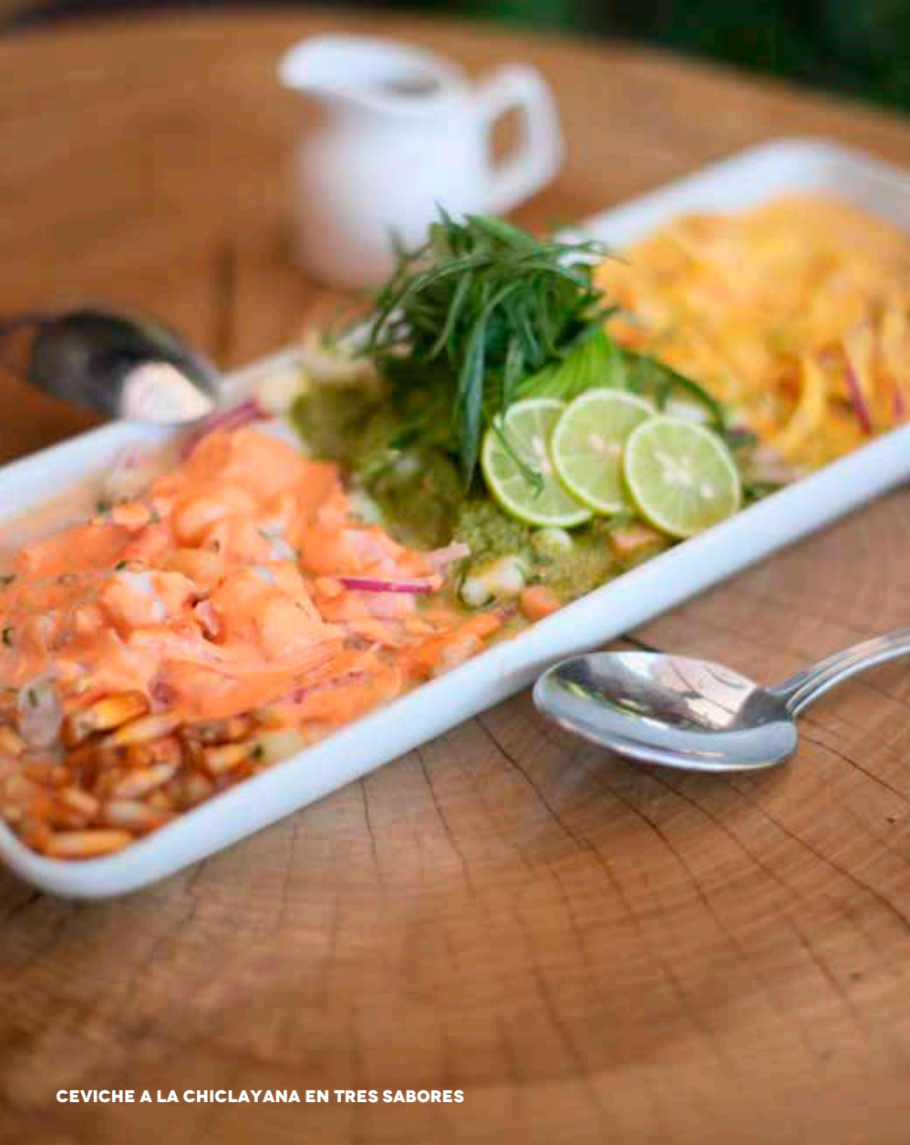
CEVICHE A LA CHICLAYANA EN TRES SABORES