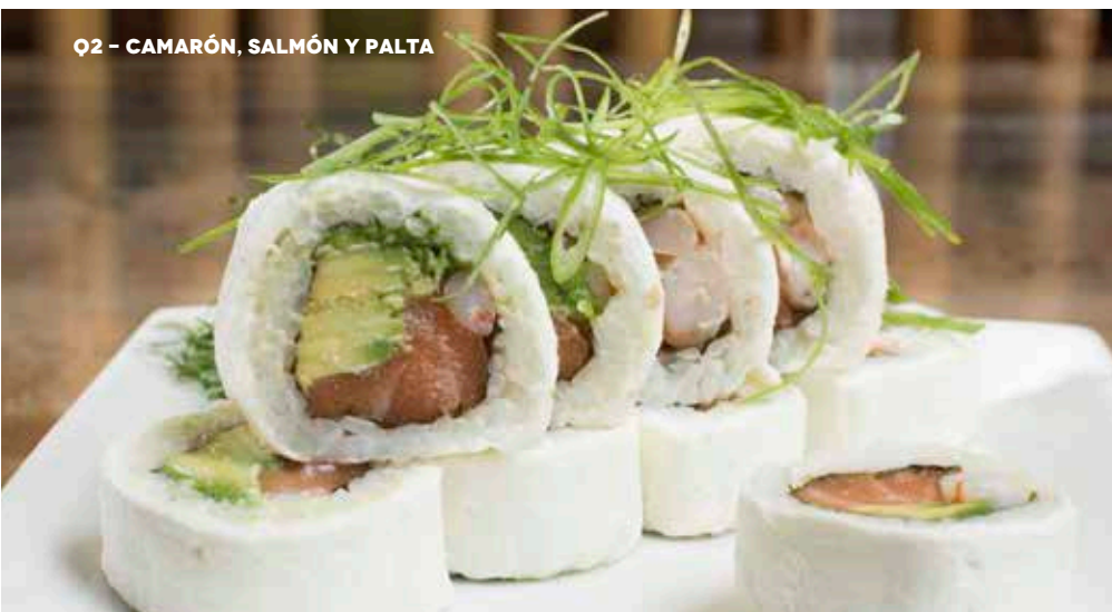
Q2 - CAMARÓN, SALMÓN Y PALTA