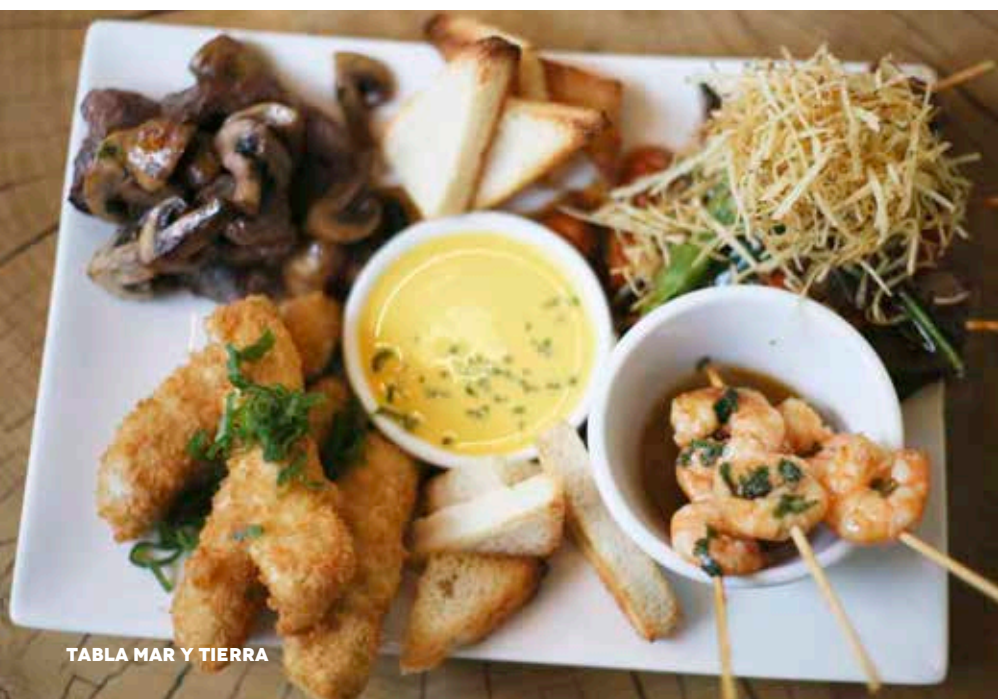
TABLA MAR Y TIERRA